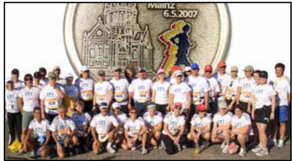
Marathon Gruppenbild aus 2007

der TVL nimmt mit 20 Teilnehmern erstmals am Gutenberg Marathon teil, der ein Jahr zuvor erstmals stattfand