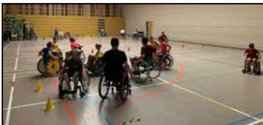
die Rollstuhl Abteilung

die heimatlose Rollstuhlsportgruppe wird in den Verein aufgenommen, kein anderer Versehrtensportverein wollte dafür die Verantwortung übernehmen