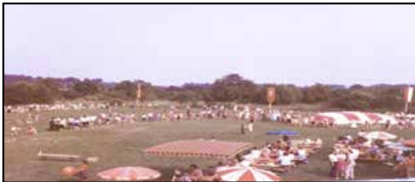
Sportgelände - Rheintalstrasse

die Goldene Ente wird zum Übungslokal, kurzzeitig der Mainzer Hof, bevor der endgültige Umzug auf das Turngelände an der Rheintalstrasse erfolgt