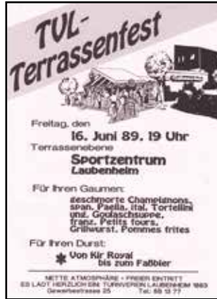
Anzeige des 1. Terrassenfestes