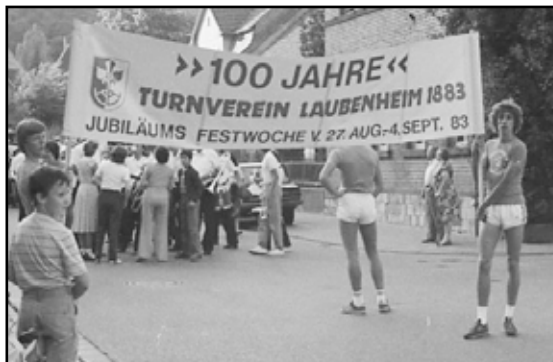
Umzug in Laubenheim zur 100 Jahr Feier