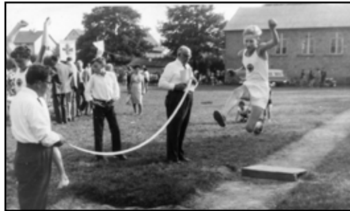
1964 - Abturnen